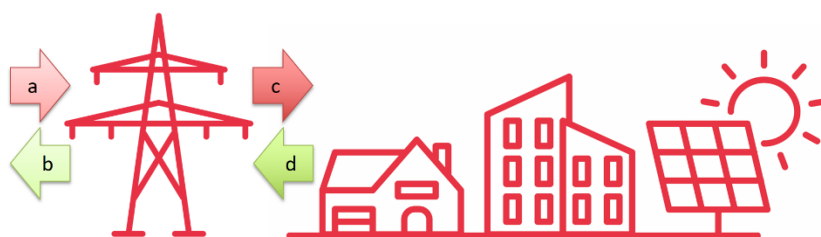
Graphique 2: données à considérer en cas d'application d'une clé complexe

En conformité avec l'art. 8quater (5) de la Loi, la CER devra assurer que l'application de sa propre « Clé complexe » assure que pour chaque quart d'heure, la somme des données de comptage de tous les points de fourniture avant le partage est égale à la somme des Bilans énergétiques quart-horaires de tous les points de fourniture.